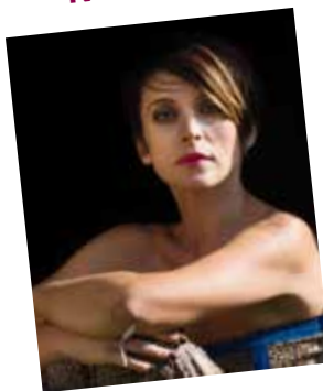
Musicista e Attrice