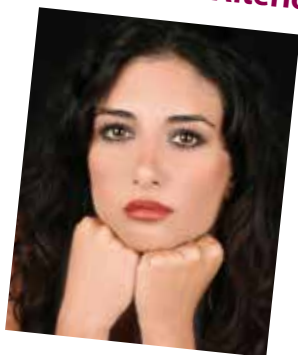
Cantante e Attrice